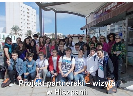
Projekt partnerski – wizyta w Hiszpanii