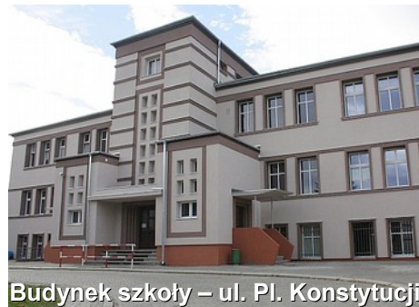
Budynek szkoły – ul. Pi. Konstytucji