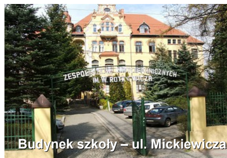
Budynek szkoły – ul. Mickiewicza