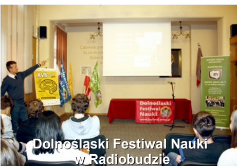
Dolnośląski Festiwal Nauki w Radiobudzie