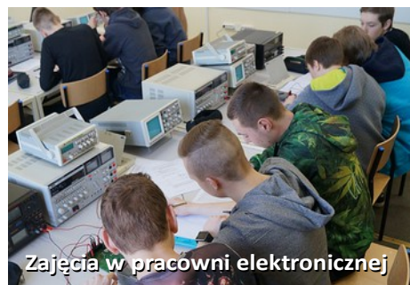
Zajęcia w pracowni elektronicznej