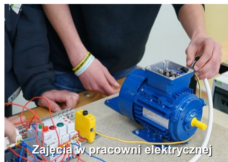
Zajęcia w pracowni elektrycznej